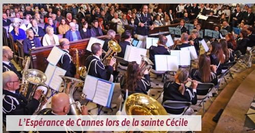
L'Espérance de Cannes lors de la sainte Cécile

Les musiciens de l'Espérance de Cannes ont donc encore plus à cœur de mener à bien cette année de centenaire, en hommage à leurs présidents.