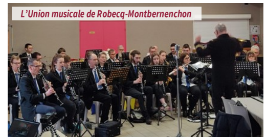
L'Union musicale de Robecq-Montbernenchon