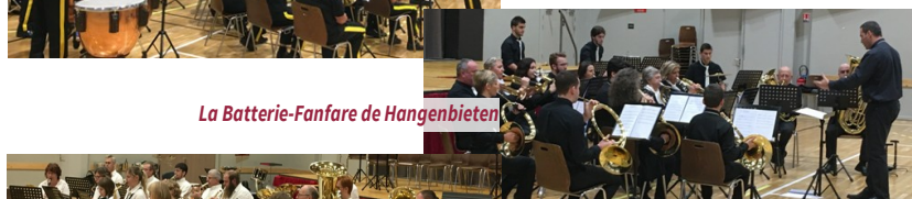
La Batterie-Fanfare de Hangenbieten