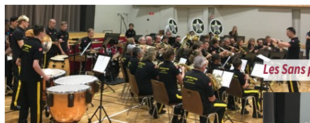
Les Sans pistons d'Eloyes