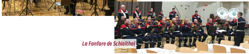
La Fanfare de Schleithal