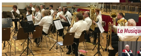
La Musique de Wingen