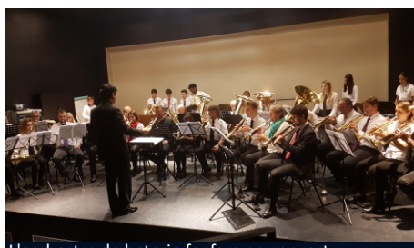
L'orchestre de batterie fanfare en concert

35 musiciens se sont retrouvés à Rouffach du 31 octobre au 4 novembre pour une session très dense avec des ateliers par pupitres, des petits ensembles et des répétitions d'orchestre de 9 à 22 heures tous les jours ! Agés de 10 à 70 ans, issus de dix sociétés, dont 10 des Sans Pistons d'Eloyes et 13 de la BF de Hangenbieten. Notons pour la première fois la participation de deux élèves du Conservatoire de Mulhouse qui ont découvert la batterie-fanfare. Des stagiaires volontaires, travailleurs, avec une forte envie d'apprendre, inventifs et avec une grande disposition à s'amuser. Une équipe d'intervenants composée de Thierry Bonneaux, Jean-Baptiste Lefebvre, Hervé Michelet, Florent Sauvageot, Christian Vives-Querol et Éric Villevière, des musiciens professionnels de très haut niveau, des pédagogues hors pair, compétents, généreux, à l'écoute, engagés, très sympathiques et faciles d'approche. Xavier Riss a assisté cette équipe au tuba.