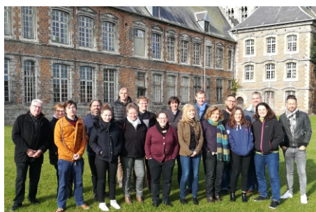
Stagiaires, intervenants et bénévoles