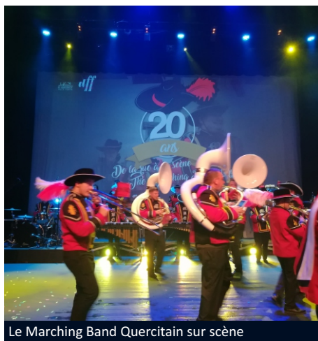
Le Marching Band Quercitain sur scène

Les 13 et 14 octobre 2018, le Marching Band Quercitain a fêté ses 20 ans au cours d'un week-end magique. Avec l'objectif de dépasser ses pratiques musicales et chorégraphiques de rue, le MBQ a littéralement transporté son public au Théâtre des 3 chênes le samedi soir en y ajoutant des jeux scéniques et pyrotechniques, des acteurs et des chanteurs. Tout y était pour faire passer au public un moment vibrant, émouvant et rempli d'une belle énergie. Après moult inquiétudes liées à la météo, les marching bands invités ont sillonné les rues de la ville sous un soleil radieux. Lequesnoy s'est transformé dans une ambiance de fête avec du show à chaque coin de rue, sous le regard