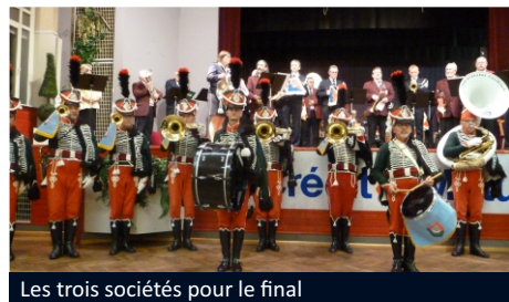
Les trois sociétés pour le final