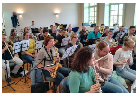
Répétition avec l'orchestre de Labeuvrière

Philippe (6 ème stage) : Je suis très intéressé pour suivre d'autres stages de direction car on n'en sait jamais assez, même pour diriger un orchestre d'harmonie composé d'amateurs d'un niveau moyen. Trop d'orchestres amateurs sont dirigés par des musiciens (parfois même des professionnels) qui n'ont jamais suivi un seul cours de direction et qui se contentent de battre la mesure se disant que c'est suffisant. Etre un bon musicien ou un compositeur