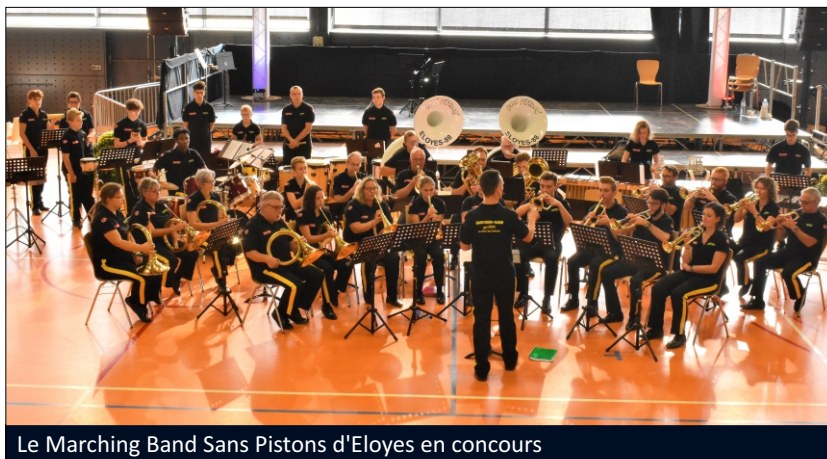
Le Marching Band Sans Pistons d'Eloyes en concours

Après un repas chaud servi aux 550 convives en un temps record, l'après-midi a été l'occasion pour deux ensembles de la fédération, classés en division d'Excellence, la Fanfare de Schleithal et la Batterie-Fanfare de Bourgfelden, de se produire en concert devant leurs pairs. En revanche, l'Harmonie-Fanfare de Bruebach et le