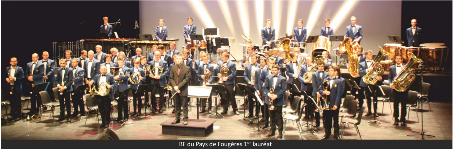
BF du Pays de Fougères 1 er lauréat