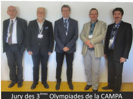
Jury des 3 èmes Olympiades de la CAMPA