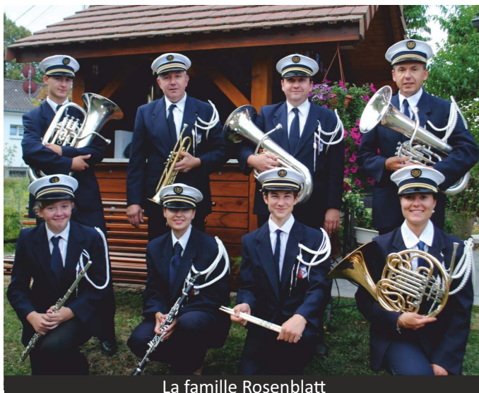
La famille Rosenblatt

Né en 1999, il débute ses études musicales en 2009. Après une année d'initiation il rejoint le conservatoire de Mulhouse dans la classe d'euphonium de Michel Hermann, où il obtient le diplôme du Certificat d'Études Musicales. Dès son plus jeune âge il est attiré par la pratique musicale et par l'esprit associatif : à 10 ans, il marchait au pas aux côtés de l'Harmonie pendant les défilés. De 2014 à 2018, il suit des études d'ébéniste dans le